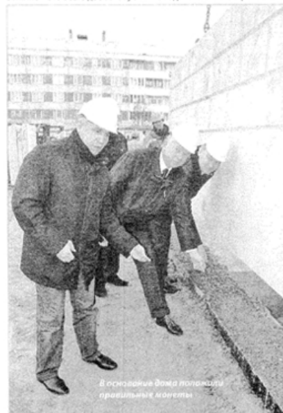
В основании дома положены правильные моменты